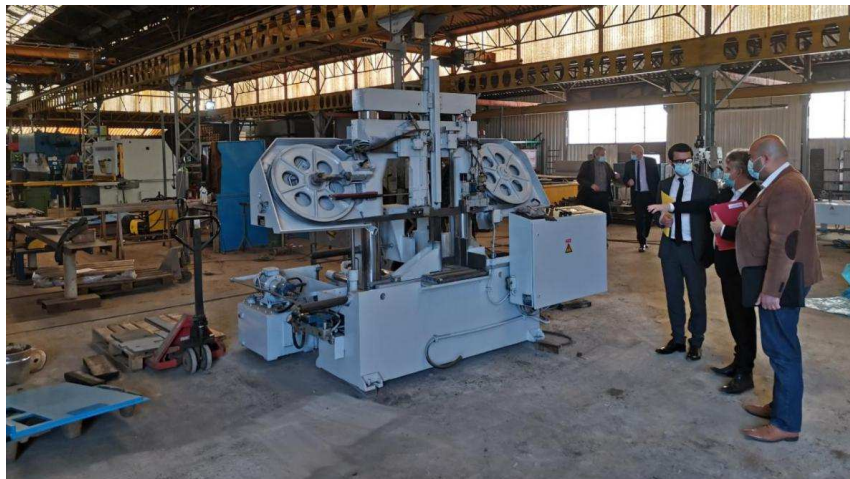
Raphaël Cardet, sous-préfet à la relance, s'est rendu à la société Dustral à Chauny le 21 avril 2021, en présence de M. Marc Delatte, député de l'Aisne.

Les mesures d'aides (fonds de solidarité, accompagnement fiscal, activité partielle) se poursuivent. Retrouvez tous leurs détails ici : https://www.economie.gouv.fr/covid19-soutien-entreprises/mesures-urgence-economiques-confinement