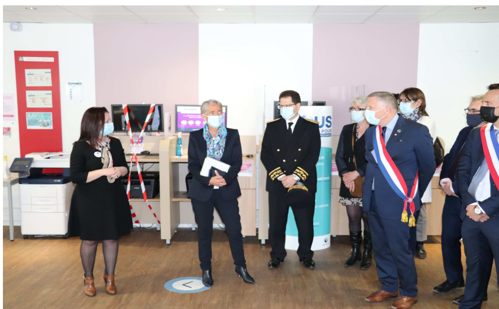
Le 22 avril 2021, Elisabeth Borne, ministre du Travail, de l'Emploi et de l'Insertion, s'est rendu à l'agence Pôle emploi de Château-Thierry, en présence de M. Ziad Khoury, préfet de l'Aisne.

Les opportunités du plan #1jeune1solution continuent de se déployer sur le territoire. Découvrez-les ici : https://www.1jeune1solution.gouv.fr/