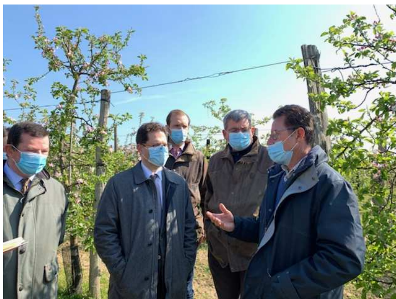
Le 22 avril 2021, M. Ziad Khoury, préfet de l'Aisne, est allé à la rencontre d'agriculteurs victimes de la vague de gel.